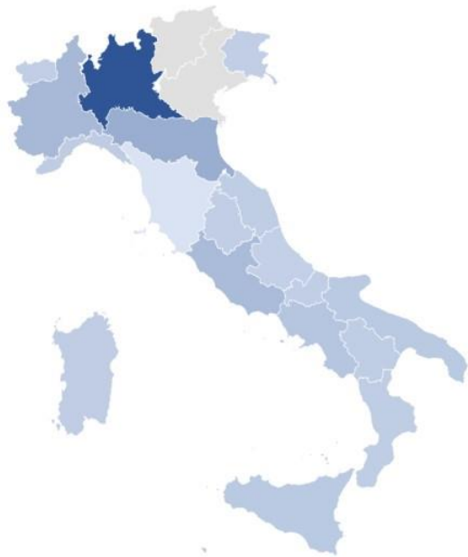
Distribuzione del patrimonio netto delle cooperative di abitazione non aderenti a Legacoop