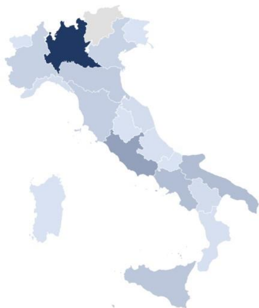
Distribuzione del valore della produzione delle cooperative di abitazione non aderenti a Legacoop